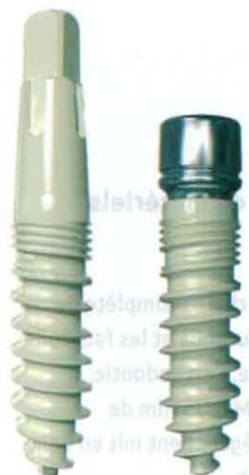
White New-Art White (R) Evolution

Fort du succès de sa gamme titane, Champions-Implants a présenté en exclusivité sa nouvelle gamme d'implants en pZircono à l'occasion de l'IDS.